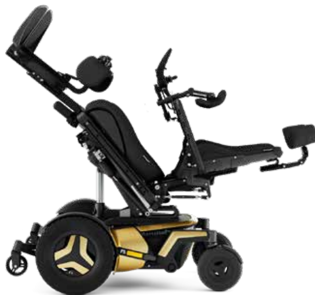
リクライニング・ティルト・足台エレベーターの複合利用