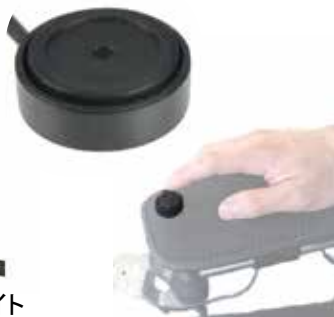
コンパクトジョイスティックライト

筋力低下等により標準ジョイスティックでの操作が困難な方に適しています。ノブのバネが標準のものより弱いので、操作が楽です。