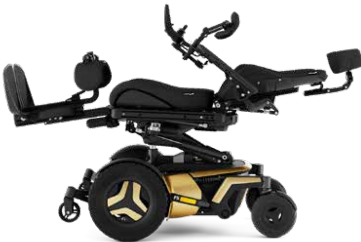
リクライニング・足台エレベーターの複合利用