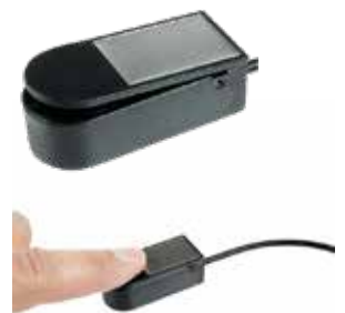
ミニジョイスティック