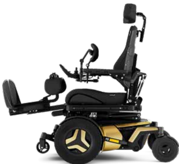
90-170° 足台エレベーター